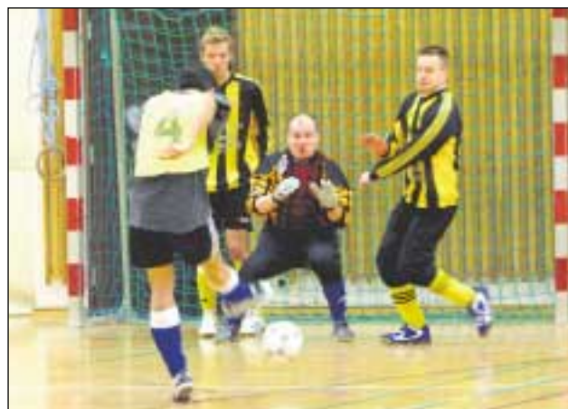
Veskareilla riitti duunia harrasteturnauksen finaalisissa. Kuvan "liimanäppi" keskittyy alkusarjan pelissä.